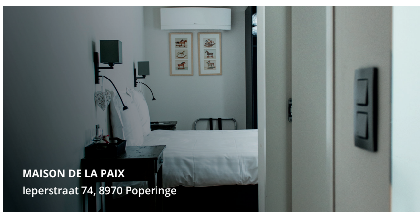
MAISON DE LA PAIX Ieperstraat 74, 8970 Poperinge