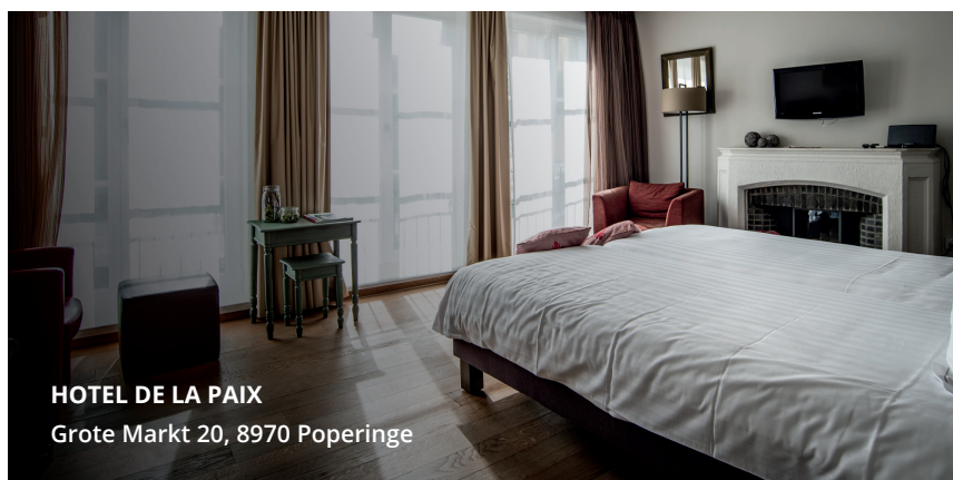
HOTEL DE LA PAIX Grote Markt 20, 8970 Poperinge