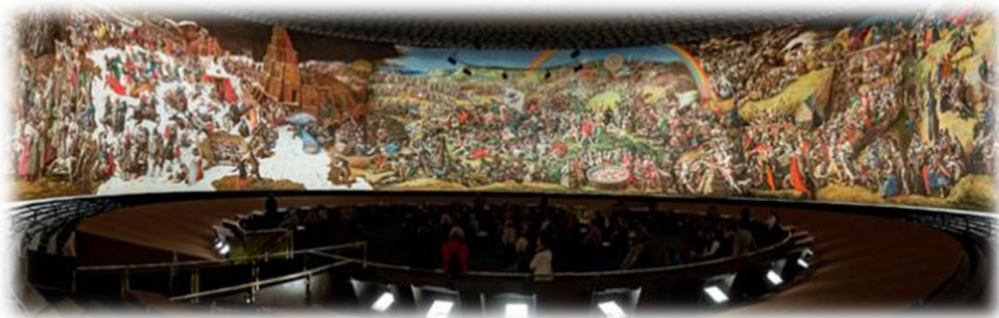
(Panorama Museum – Bad Frankenhausen)

Bad Frankenhausen was tot ongeveer 500 jaar geleden een plaats van een bloederige geloofsstrijd waarbij predikant Thomas Müntzer als navolging van de welbekende Wittenbergse reformist Martin Luther tot compromislose strijd opgeroepen heeft om een Rijk der uitverkorenen Gods op te richten. Het museum is een cilindervormig gebouw en herbegeet een indrukwekkend schilderij van 14 meter hoog en 123 meter lang. De imposante panorama-afbeelding „Frühbürgerliche Revolution in Deutschland“ (burgerlijke revolutie) behoort met haar meer dan 3000 personages tot de grootste en schilderijen met daarop de meeste figuren en zal zeker een belevenis zijn. Bij onze ingang vindt u een brochure van dit museum.