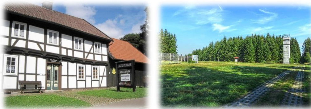
(links: Alte Pfarre – rechts: Grenzlandmuseum)

Dit museum laat u veel zien van de geschiedenis van het dorp zelf en uit de tijd, dat Hohegeiß aan de toenmalige grens met de DDR lag. De „Alte Pfarre“ (letterlijk: oude parochie), een vakwerkhuis uit het jaar 1644, getuigt zelf ook van deze veelbewogen geschiedenis. Binnen in dit oudtse pand van Hohegeiß wordt u de historische ontwikkeling van het in 1444 opgerichte dorp gepresenteerd. Met zijn ligging midden in de Harz speelt de mijnbouw hier een bijzondere rol. Niet alleen de daarmee samenhangende beroepen, maar ook de ontwikkeling van het toerisme in de 19 e eeuw zijn onderwerpen van de vaste expositie van dit museum. In een apart gedeelte besteedt het museum puur en alleen aandacht aan de toenmalige tweedeling van de beide Duitslanden. Hier ziet u bijvoorbeeld schaalmodellen en originele museumstukken van o.a. een grenspost. Voor openingstijden en verdere info kunt u terecht bij de receptie.