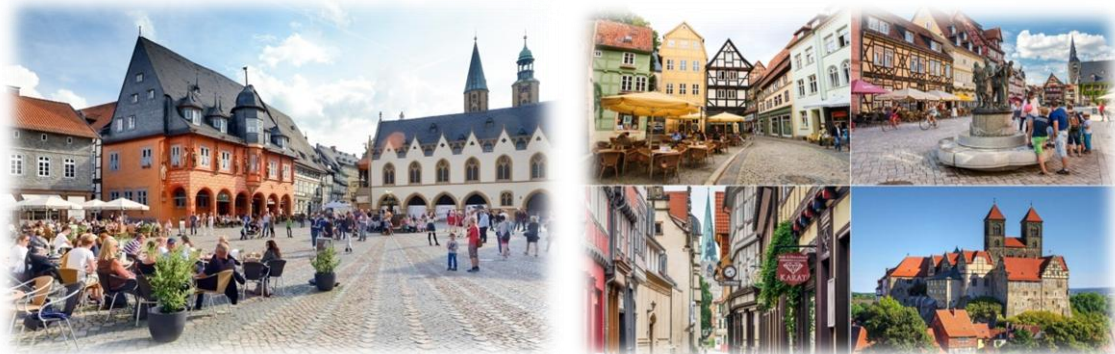
(links: Goslar – rechts: Quedlinburg)

Tot de belangrijkste bezienswaardigheden van de stad Goslar behoren de romaanse, gerestaureerde keizerpalts en het marktplein met daaraan gelegen het Stadhuis, de Marktbrunnen (fontein) en de Marktkirche (kerk). Het stadsbeeld wordt gemarkeerd door mooie burgerwoningen en andere gebouwen in de typerende vakwerkstijl. Ook biedt de stad een aantal musea die een bezoekje waard zijn zoals het Bergbaumuseum Rammelsberg waar u een kijkje kunt nemen in de rijke historie/traditie van de mijnbouw.