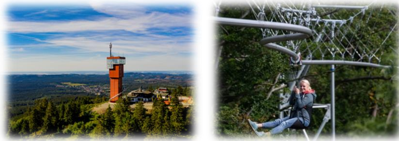
(links: Wurmberg – rechts: Baumschwebebahn)