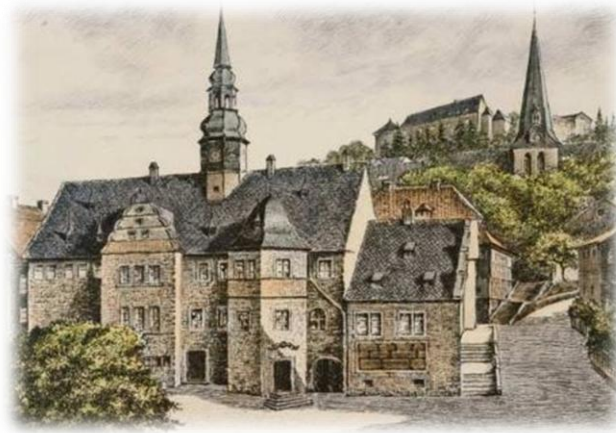
(Blankenburg Rathaus und Burg)

Tussen de Brocken en het Bodetal, precies tussen Wernigerode en Quedlinburg, ligt de Blütenstadt (bloesemstad) Blankenburg. Als cultuursnuiver, bergvriend of tijdreiziger vindt u hier interessante reisdoelen en de stad zal u verrassen met barokke schoonheden en imposante rotspartijen. Ontdek het grote kasteel „Schloss Blankenburg“ met zijn meer dan 900 jaar oude geschiedenis, de betoverende tuinen van Blankenburg, de burcht, de vesting Regenstein met haar indrukwekkende uit rots gemaakte ruimtes en het klooster Michaelstein. Ook het Herbergsmuseum is zeker de moeite van het bezoeken waard: het geeft u een inkijkje hoe de handwerkers rond 1900 leefden. Bij onze ingang vindt u van de stad Blankenburg een brochure.