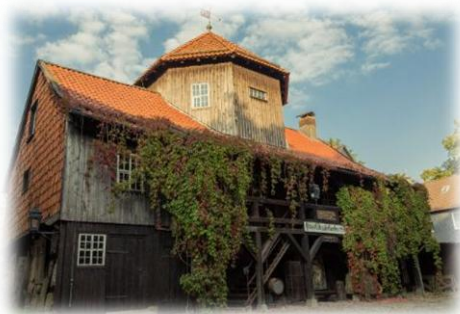
(Bergwerksmuseum Clausthal - Zellerfeld)

Dit oudste mijnmuseum van Duitsland werd opgericht in 1892 en biedt met zijn totaal van 29 tentoonstellingsruimtes, een openluchtmuseum en een mijnschacht een blik in de cultuurgeschiedenis en de ontwikkeling van de mijnbouw in de Oberharz van de middeleeuwen tot aan zijn einde in het jaar 1930. Het museum behoort tot het UNESCO werelderfgoed. De verzameling van het museum laat u een scala zien van historische gereedschappen en archeologische vondsten, maar ook diverse voorwerpen uit het dagelijks leven geven een goede indruk van het werk en het leven van de bevolking die van de mijnbouw afhankelijk was. Met een „Mini-Tag im Bergwerk“ kunt u met alle zintuigen het dagelijks leven uit die tijd beleven in de vorm van een rondleiding waarbij u vanuit een schachtgebouw afdaald naar een waarheidsgetrouwe mijngang.